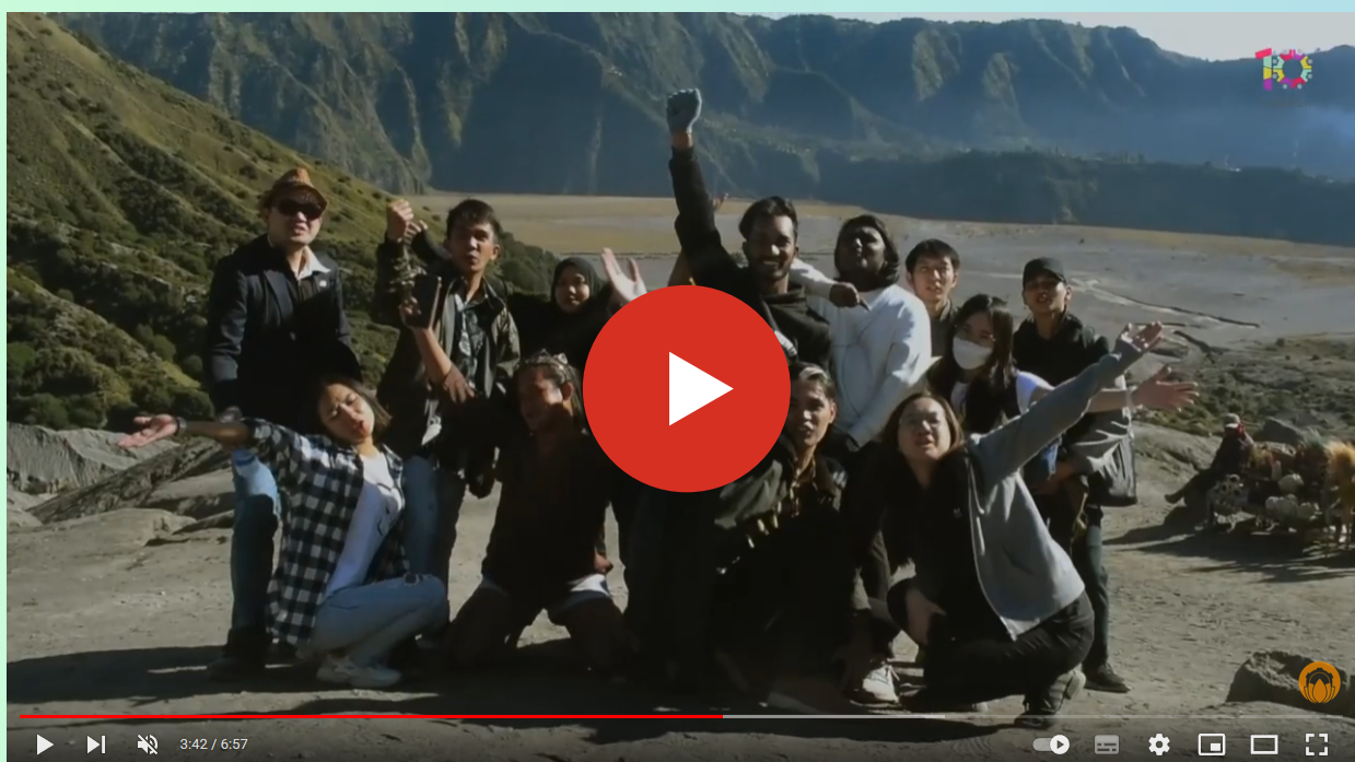
昨年度実施されたCommTECHの様子

お問合せ：国際交流推進センター st-ab@mail.admin.saga-u.ac.jp Instagram:saga_u.kokusai2021