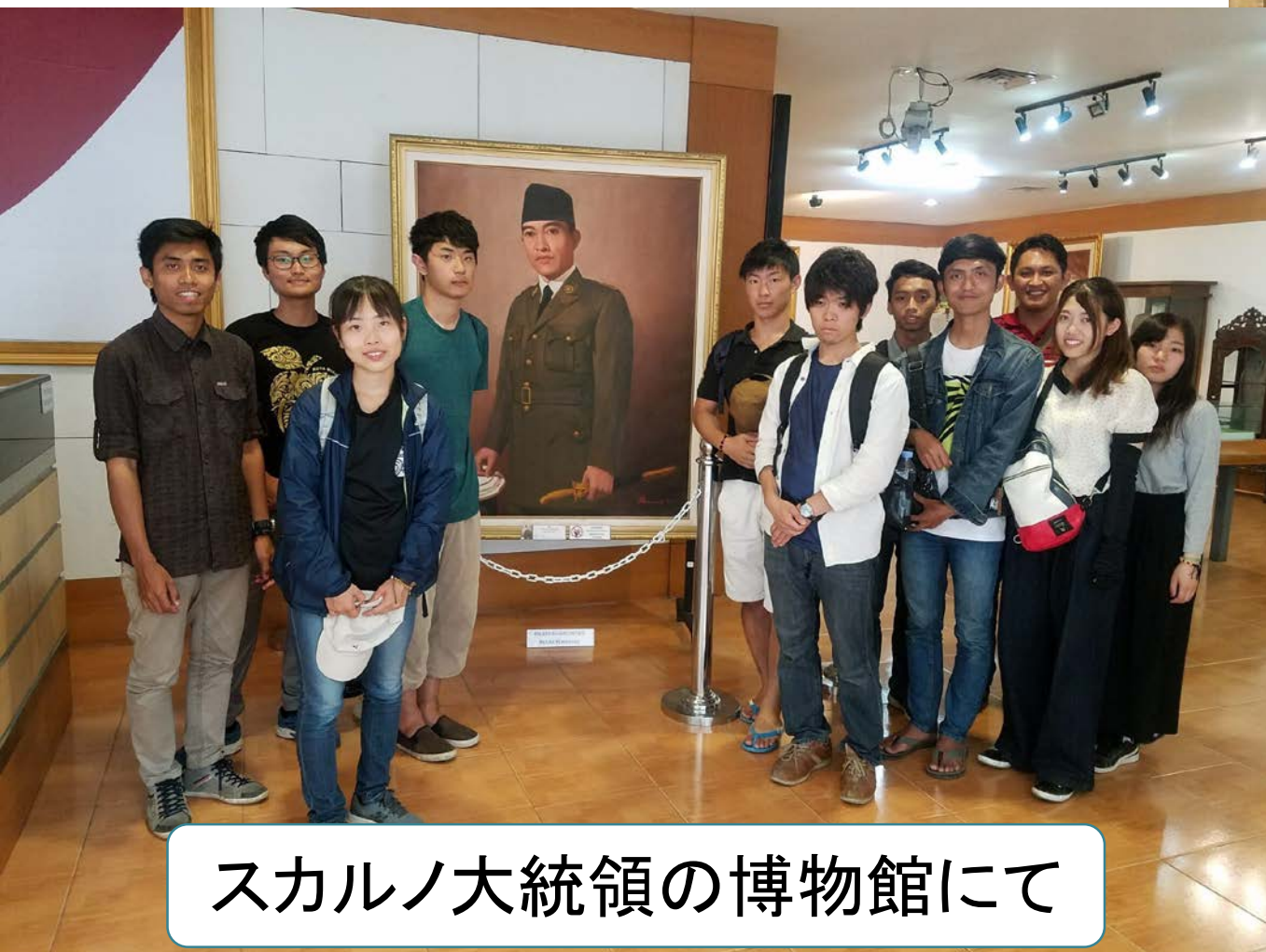
スカルノ大統領の博物館にて