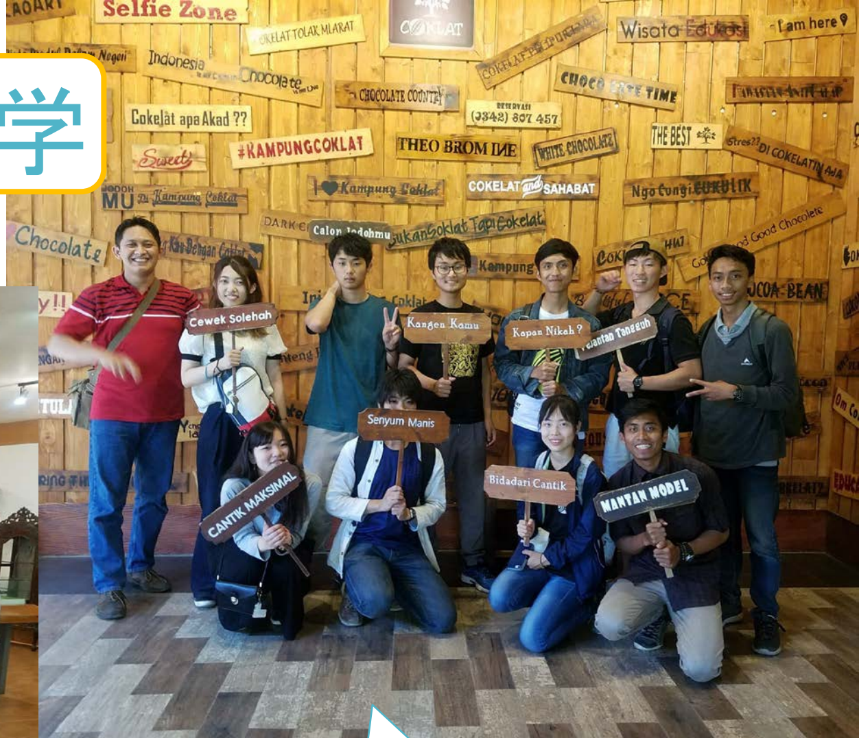
チョコレート村で 記念撮影