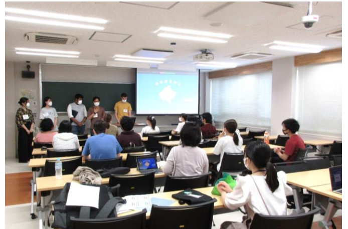
留学生による母国についてのプレゼンテーション

会場に入るとすぐに、主催者の学生たちが「こんにちは…留学生ワークショップへようこそ」と歓迎の声で迎えてくれました。会場にはすでにたくさんの学生が集まっており、自己紹介をしている人もいれば、留学生とコミュニケーションを取りながら英語力を磨いている日本人学生もいました。時間になると、イベントは始まりました。