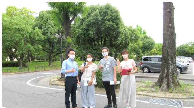
ゲームを楽しむ学生

参加者は5人ずつのグループに分けられました。イベントのミッションは隠された言葉を見つけることです。佐賀大学の地図とクイズが全員に渡されました。それぞれのクイズへの答えは、私たちが隠された言葉を見つけ出すための手がかりです。私たちはキャンパスを探索し、チームで協力をしながらクイズの答えを見つけ出しました。